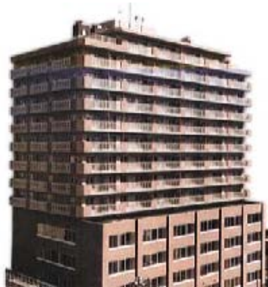
(南3条グランドビル)